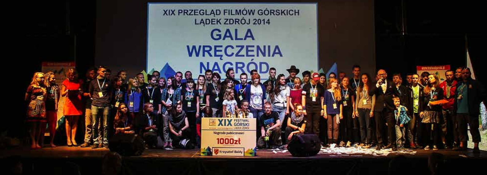
Organizatorzy i wolontariusze XIX Przeglądu Filmów Górskich w komplecie