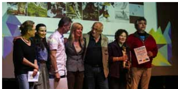
Rozdanie nagród za najlepszą książkę górską