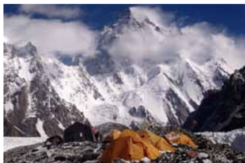
Baza pod Broad Peak. W tle K2