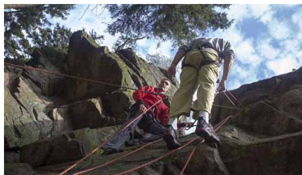
Pokaz ratownictwa górskiego