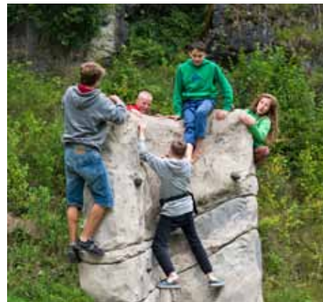
Juniorzy na Frankenjurze