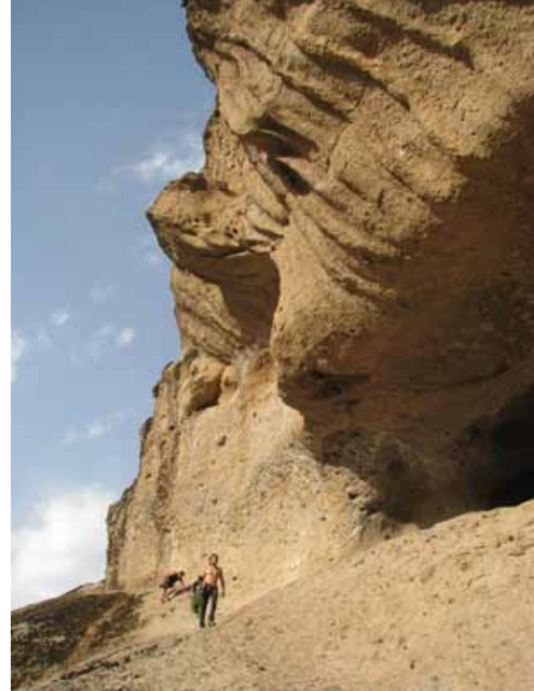
Baraghan gory Elburs