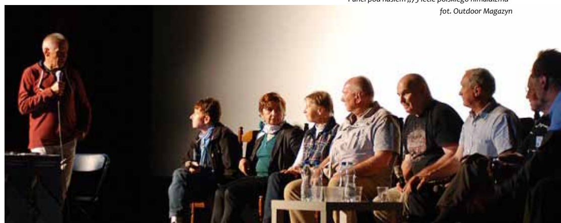
Panel pod hasłem „75-lecie polskiego himalaizmu”