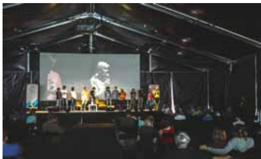
Panel jaskiniowy w Łądku Zdroju

Komisja Taternictwa Jaskiniowego PZA zaprasza do składania wniosków o dofinansowanie wypraw, które odbędą się w 2015 roku. Szczegóły w komunikacie . UWAGA: wnioski składamy do 22 października!