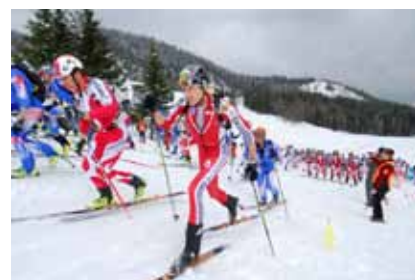
Zawodnicy na trasie Memoriału Malinowskiego w Tatrach