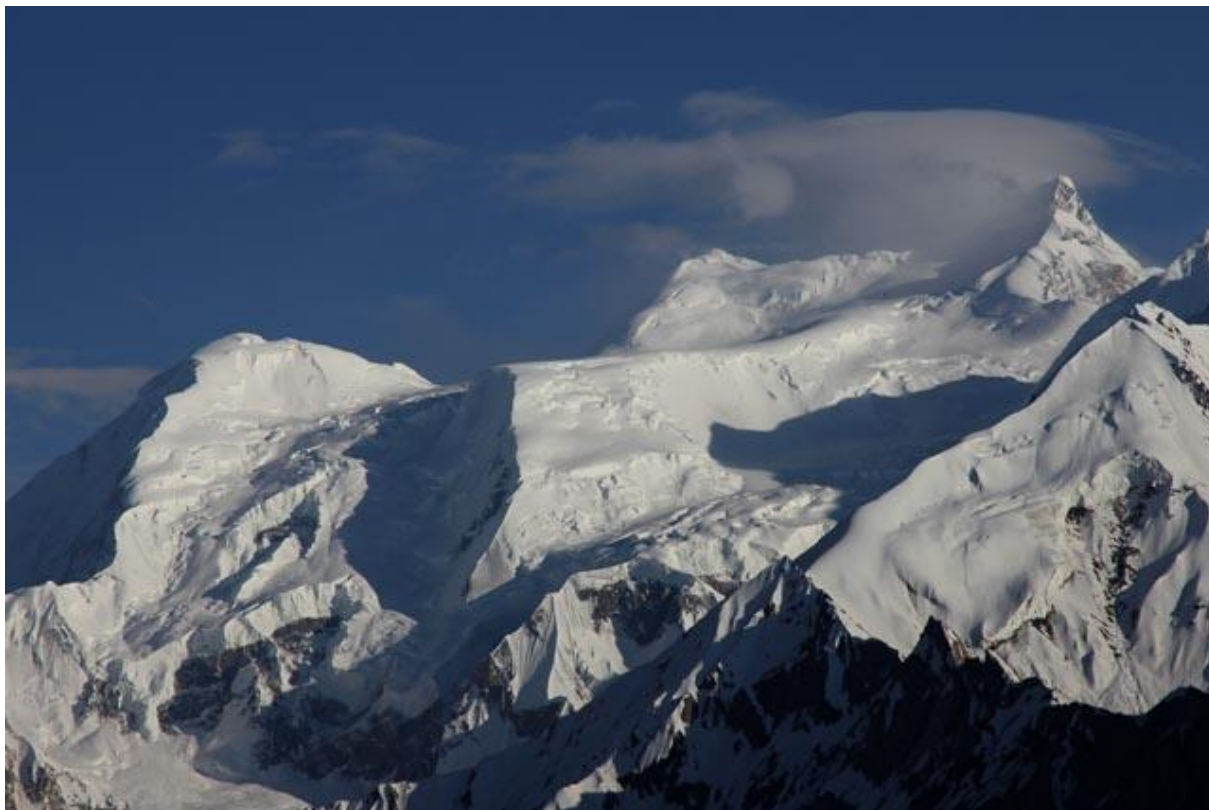
Grupa Malubiting od północy. Od lewej Malubiting Północny, Centralny, Zachodni i pod nim w grani północno-zachodniej dziewiczy Malubiting Północno-Zachodni.