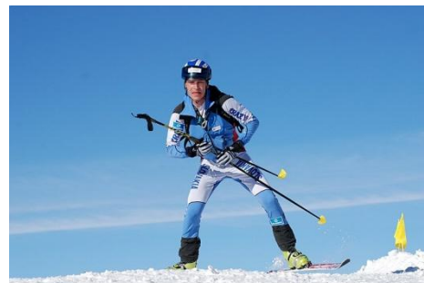
Fot. Maciej Bielawski – „Znowu pierwszy”