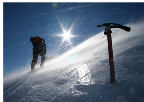
„Zawieja śnieżna na Siwych Turniach”