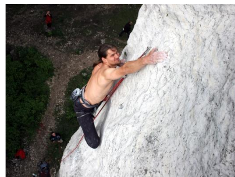
Fot. Piotr Szamocki - „Donos VI.5”