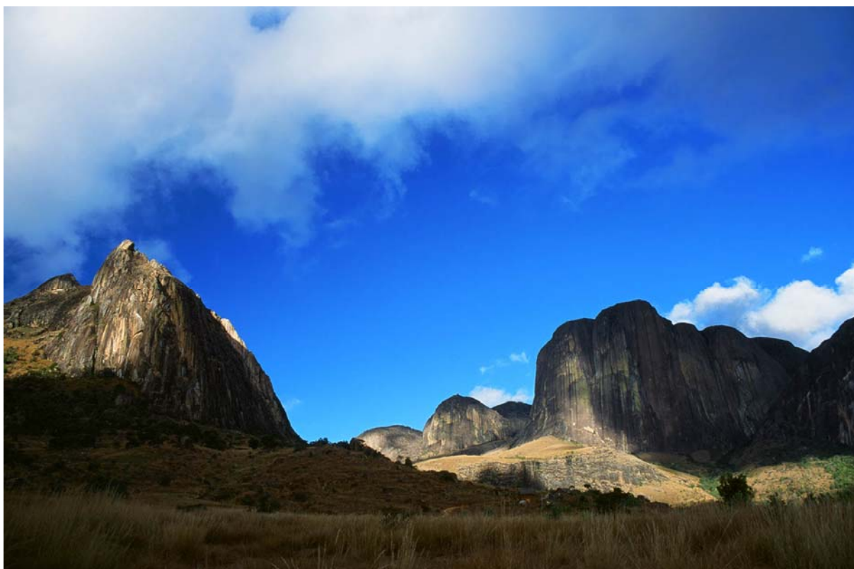
Ryc. 1. Masyw Tsaranoro i Chamelon

Dofinansowanie PZA: 1200,00 zł (kwota ta pokryła 12% wszystkich wydatków dla jednej osoby związanych z wyprawą)